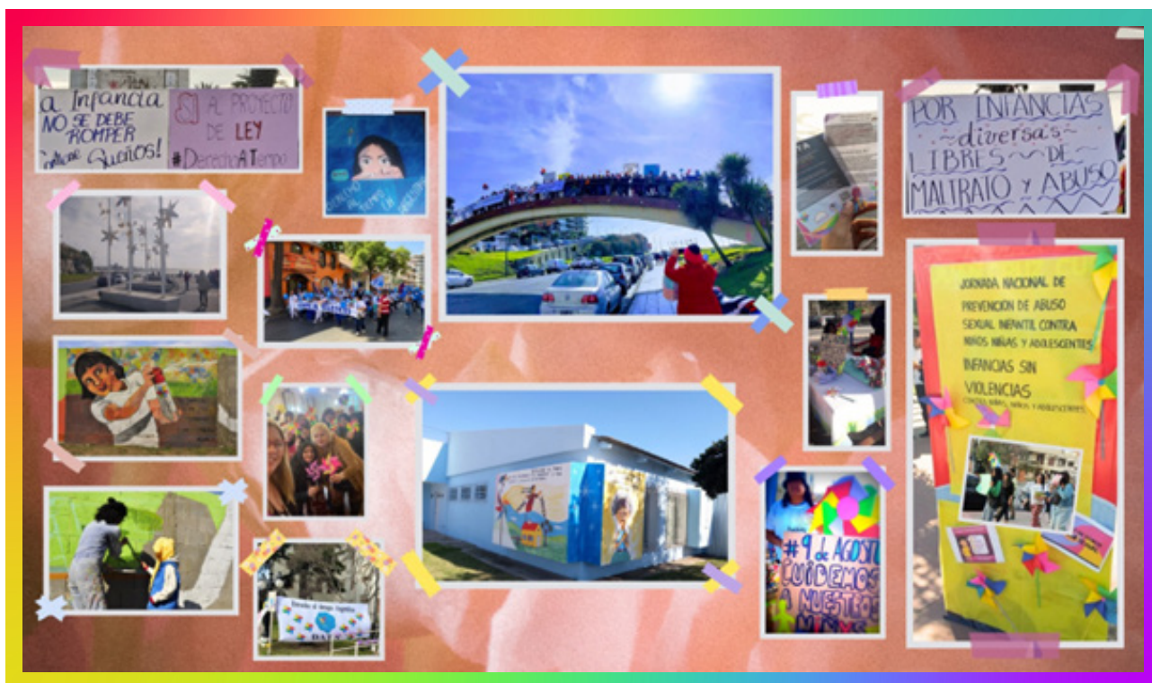
(campaña 9 de agosto en todo el país y en algunos países de latinoamérica)

Escaneá el QR para leer los proyectos de ley completos