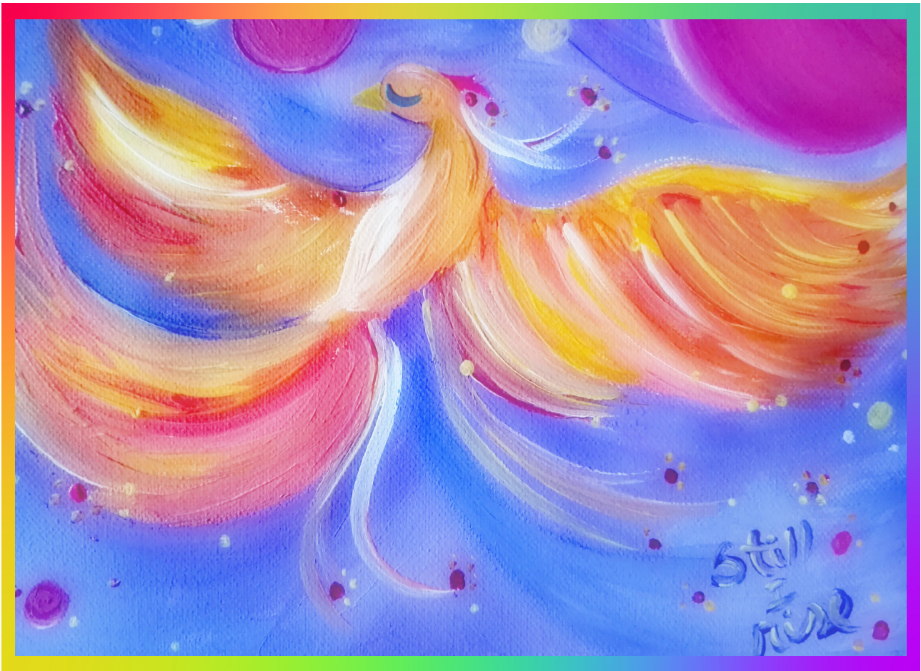
Ilustración de Luz del Alma