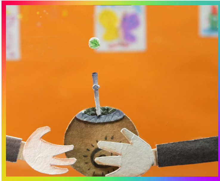
“Hay secretos” del grupo musical para las infancias Canticuénticos Hay secretos - CANTICUÉNTICOS