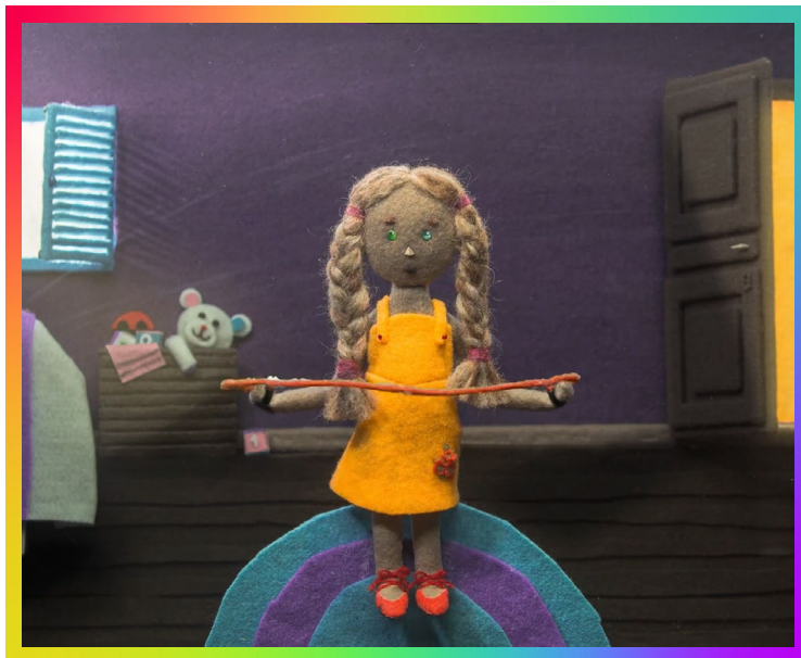
Cortometraje animado de ARALMA asociación civil sobre violencia sexual Play, un cortometraje de ARALMA