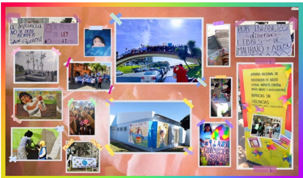
(campaña 9 de agosto en todo el país y en algunos países de latinoamérica)

Escaneá el QR para leer los proyectos de ley completos